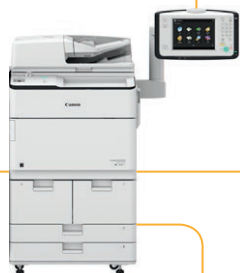
PAINEL DE CONTROLE VERTICAL **